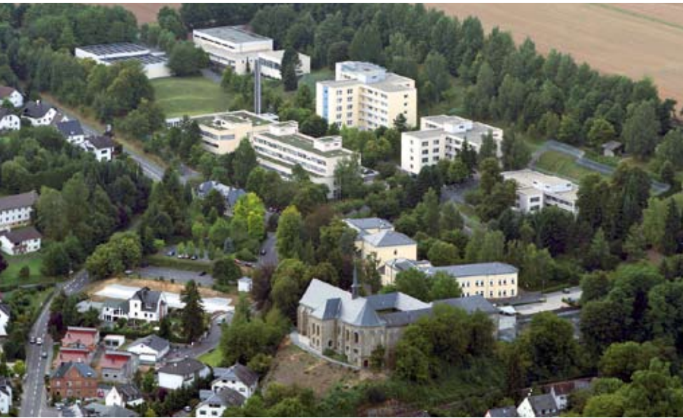
Auf dem Gelände verteilt: Mehrere Gebäude des Zentrums für Soziale Psychiatrie werden von der forensischen Psychiatrie genutzt.