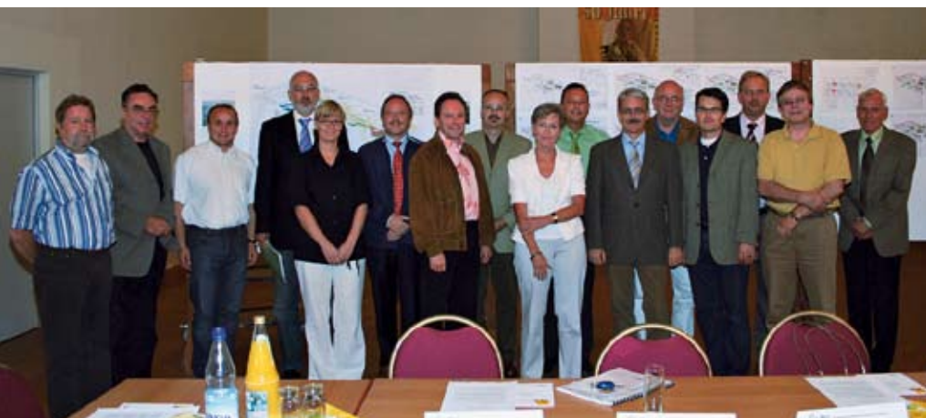
Einstieg in ein komplexes Thema: Mitglieder des Hadamarer Forensikbeirates bei der konstituierenden Sitzung.