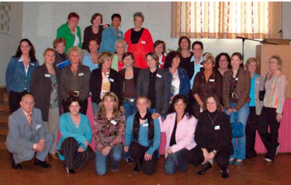
Das Team der Frauenstation der KFP Hadamar.

lautete der Titel der 2. Hadamarer Frauenfachtagung, die das gesamte Team der Frauenstation mit großem Engagement im Mai in der Klinik für forensische Psychiatrie (KFP) organisiert hatte. Mit Erfolg: 160 Expertinnen und Experten trafen sich, um sich mit dem Thema der Persönlichkeitsstörungen von Frauen im Maßregelvollzug auseinander zu setzen. Dieses Thema wurde gewählt, weil bei einem hohen Prozentsatz der Patientinnen im Maßregelvollzug die Diagnose Persönlichkeitsstörung gestellt wird. Diese bundesweit einzige Tagung, die sich mit Frauen im Maßregelvollzug beschäftigt, knüpfte inhaltlich insofern an die erste an, als dort bereits deut-