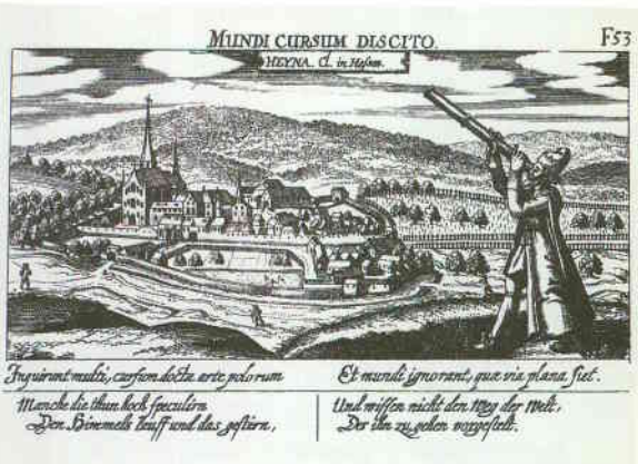
Die Hainaer Kirche mit dem neuen Turm aus dem 17. Jahrhundert, Postkarte