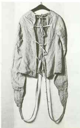
Zwangsjacke, 19. Jahrhundert

Band 6: Wissen und irren. Psychiatriegeschichte aus zwei Jahrhunderten – Eberbach und Eichberg, herausgegeben