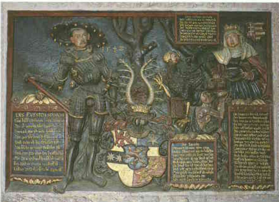
Der „Philippstein“ in der Hainaer Klosterkirche von Philipp Soldan aus Frankenberg, 1542, zur Erinnerung an die Hospitalkirche

Ausstellung im Klinikum Weilmünster, Sozialzentrum (Haus 105), Weilstr.10, D-35789 Weilmünster, Öffnungszeiten: Montag – Freitag 9.00 – 16.00 Uhr. Tel. 0049 (0)6472/60-255