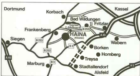
Der Weg nach Haina

Funktionsbereich 060.2 „Archiv, Gedenkstätten, Historische Sammlungen“ des LWV Hessen, Ständeplatz 6-10, Frau PD Dr. Christina Vanja D- 34117 Kassel, Telefon 0049(0)5 61 / 10 04-2277, Telefax 0049(0)5 61 / 10 04-1277 Email: kontakt-archiv@lwv-hessen.de