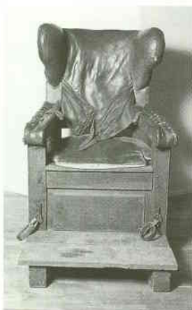
Zwangsstuhl, 19. Jahrhundert