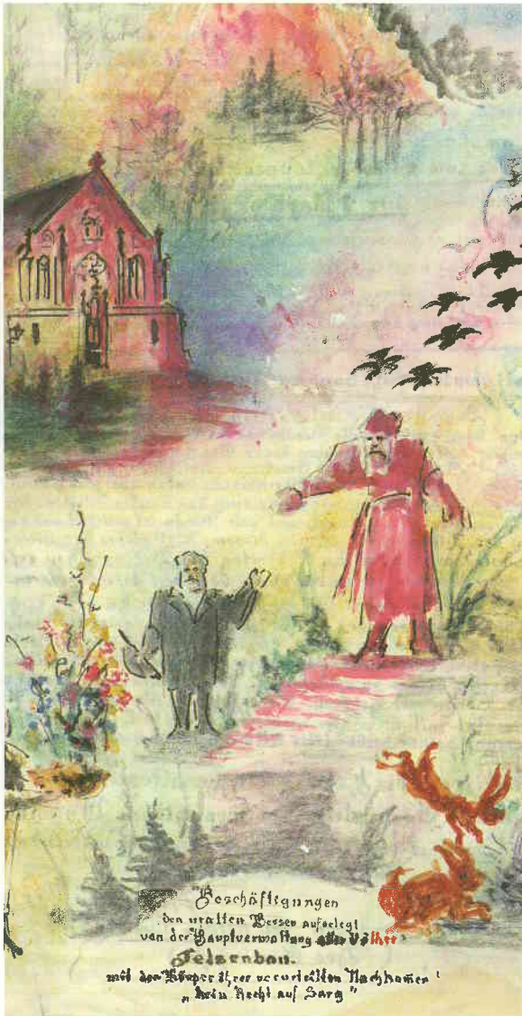
Das Landeshospital Haina, Gemälde eines Hainer Patienten um 1900